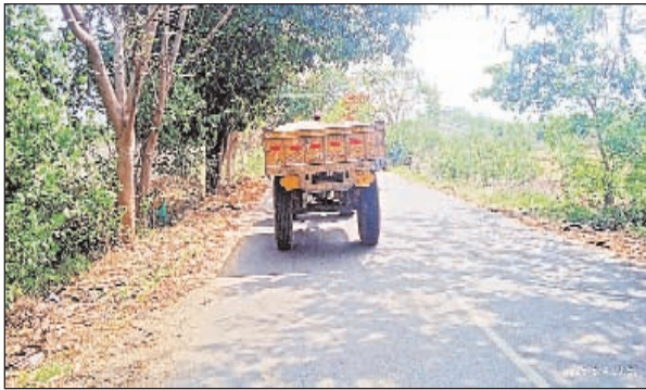
సొమ్ముచేసుకుంటున్నారని ప్రజలు ఆరోపిస్తున్నారు.

జిల్లాలోని నర్సింహాలపేట మండలంలోని కొములవంప, రామన్నగూడెం, ముంగిమడుగు, కొనల్యదేవి పల్లి గ్రామాల ఇసుక రవాణా నుండి ప్రతి రోజు 30నుండి 40ట్రాక్టర్ల అక్రమ ఇసుక రవాణా జరుగుతుందని ఒక్కో ట్రాక్టర్ కు సుమారు 5 నుండి 6వేల వరకు విక్రయించి