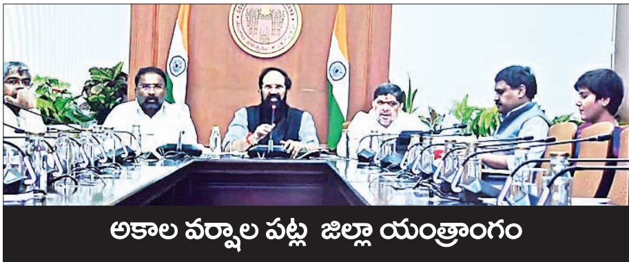
అకాల వర్షాల పట్ల జిల్లా యంత్రాంగం